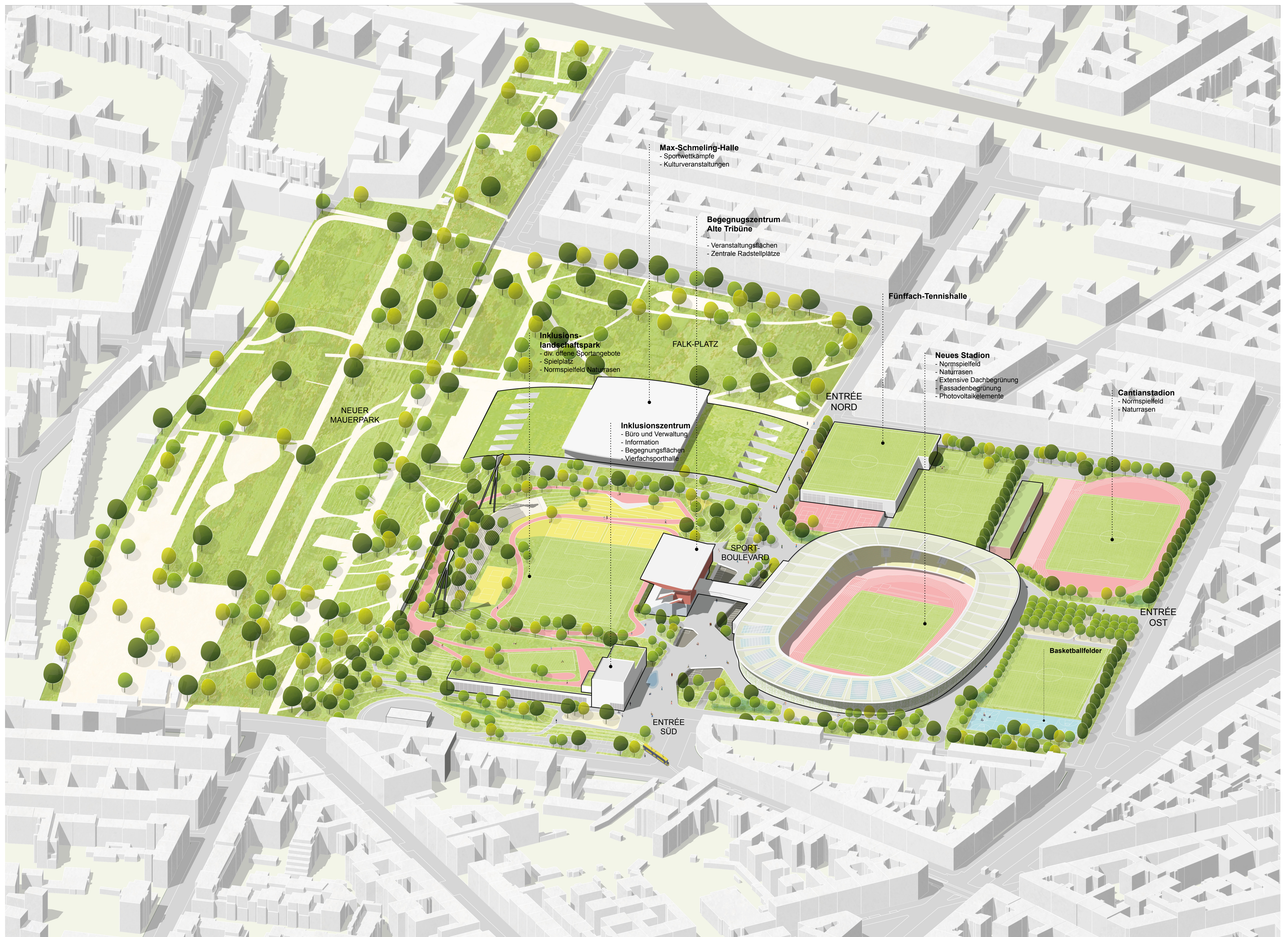
Axonometrische Darstellung Sportpark